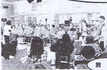
みんなで歌おう.....「たのしいお!」を全員合唱 出演グループ

2010年12月11日(土) 午後1時~4時 朝霞市民会館(ゆめぼれす) 1階リハーサル室