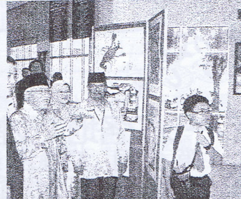
ゴンバ地方教育事務所へお届け