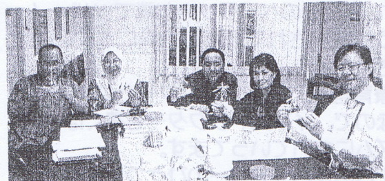
ピエロを手に・サバ州立図書館局長（右端）達

ボランティアのOさんは、時折ミニデイの日遊びにお越しになります。そのときなんとストラップ用ピエロを30個も作ってくださいます。「詰まんないテレビを見ないで、座ったら作っているといっぱいになるのよ！」とさりげなくおっしゃいます。ミニデイ参加者とヘルパーさん達が作ったものもマレーシア各地で喜ばれています。