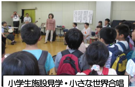
小学生施設見学・小さな世界合唱