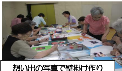
思い出の写真で壁掛け作り