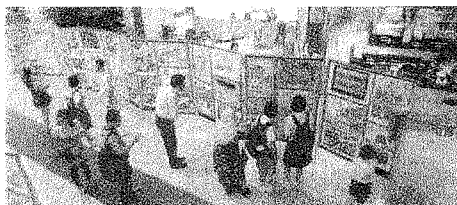
セランゴール州 Taman Ehsan 中学校で交流