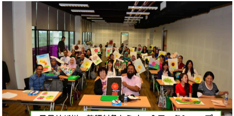
7月サバ州 教師対象セミナー&ワークショップ