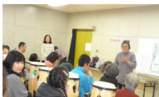
さあー！はじめます。第13回