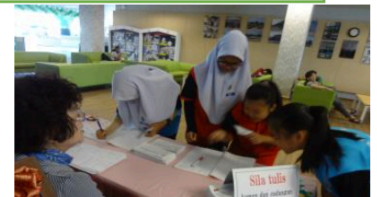
両国の280点を展示、大勢が来場・感想も10歳~72歳の方が記入

「絵を通じての友好」とはプログラムは、小学生にとって最初の外国・国際活動になる場合も多く人気がある。お互いに作品が戻らないという難点はあるが、自分の作品が役に立っているという気持ちで、写真と国際友好賞状で顕彰させていただいている。マレーシアでも、各学校で大切に展示され、セミナーやワークショップも期待されて、参加のリピーターもいらっしやる。2月に行なわれたゴンバ地方教育事務所管内では、小学校図工主任が、全小学校から参加、2日間に分けて実施。この10月から、ウルセランゴール地方教育事務所も初めて実施予定で、うれしい広がりである。