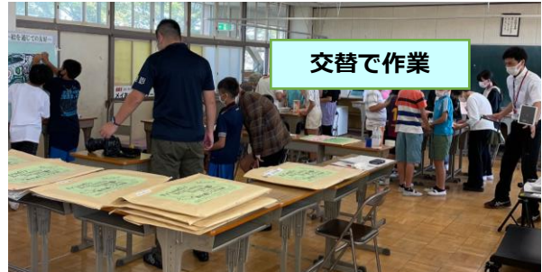
多くの作業の一部を体験 プロのカメラマンと撮影

「絵を通じての友好」は、35年にわたり、マレーシアとの間を繋いできた。朝霞第六小学校区に事務所を持つ弊法人の取り組みを、地域とともにある学校を目指す、コミュニティスクール朝霞第六小学校が、6年生の授業に採りあげてくれた。